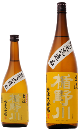
SAKE TATENOKAWA Junmai Daiginjo Shuryu (Vogue) Limited 楯野川「主流」純米大吟醸《限定流通品》 Alcool 15,5 % Polissage du riz à 50%