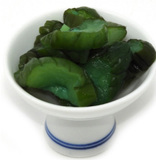
AOKYURI Concombre mariné 青きゅうりの醤油漬け Code 202177 1 KG Prix € 9,99