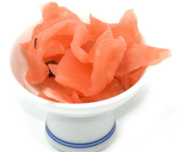
SAKURAZUKE Radis mariné 桜大根漬け Code 202179 1 KG Prix € 7,99