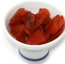
FUKUJINZUKE Radis mariné 福神漬け Code 202178 1 KG Prix € 7,99