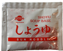
BASE DE SOUPE RAMEN - SHOYU Shoyu ramen soup Code 200689 36 G x 70 pcs Prix € 22,50 Sun Noodle