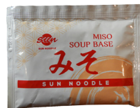
BASE DE SOUPE RAMEN - MISO Miso ramen soup Code 200690 45 G x 60 pcs Prix € 26,50 Sun Noodle