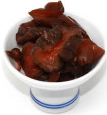
SHIBAZUKE Concombre mariné きゅうりのしば漬け Code 202176 1 KG Prix € 10,99